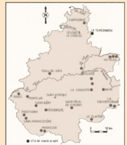
Plan de moulin, rose des vents et localisation des moulins à vent de l'arrondissement de Millau (relevés et dessins de M. AZEMA, Moulins à vent en Rouergue, Severac, mai 2002).

Le moulin existait encore en 1852. Afin de pouvoir régler ses ailes et orienter son toit mobile, le meunier, Antoine Chamayou, habitait à proximité. Il y transformait annuellement 150 hectos de blé et seigle, au prix de 12 francs l'hecto. Le moulin possédait une paire de meules, meules qui étaient probablement extraites de la carrière de la Molière sur la commune voisine de Brasc ou celle de l'Hôpital car le banc de grès très fin et homogène de couleur ocre chargé en silice s'étend sur 5 hectares (les hameaux sont visibles depuis le belvédère). La carrière de l'Hôpital est encore en activité aujourd'hui pour des pierres à bâtir très réputées.